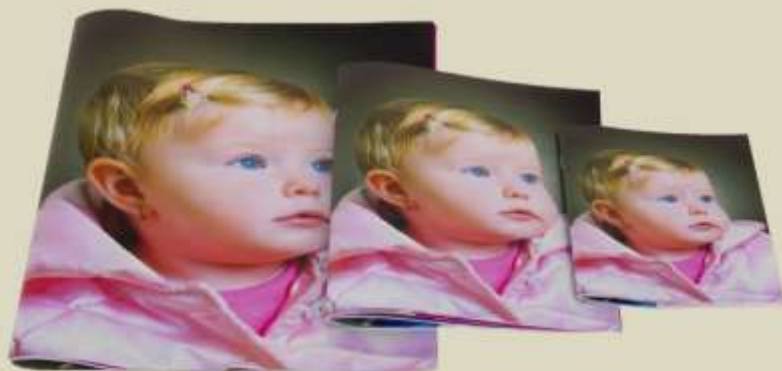
*Imagens meramente ilustrativa